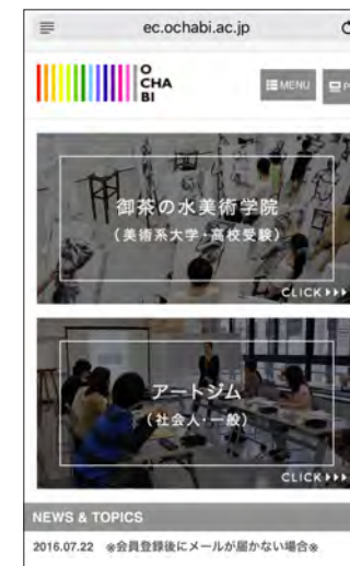
■ スマートフォンより